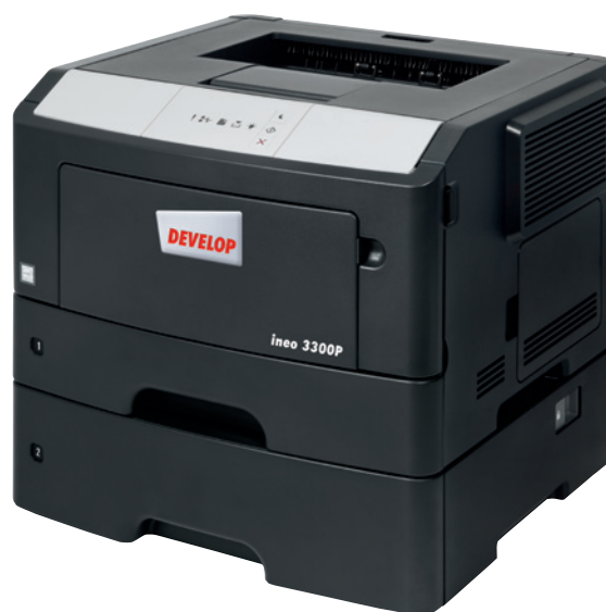
ineo 3300P z dodatkowym podajnikiem papieru na 550 arkuszy (PF-P12)

Jeżeli skomplikowany system operacyjny Twojej obecnej drukarki przyprawia Cię o ból głowy, a samo urządzenie jest trudne w obsłudze, czas, aby pomyśleć o zmianie na ineo 3300P. Prostota obsługi pozwoli Tobie i Twoim pracownikom zaoszczędzić czas i wysiłek podczas codziennych prac. Ponadto, aby korzystać z tej nowej drukarki, nikt nie będzie musiał zaglądać do instrukcji obsługi.