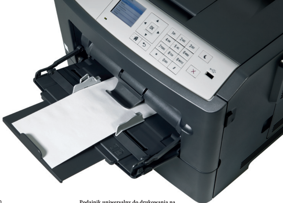
Podajnik uniwersalny do drukowania na materiałach specjalnych, takich koperty

Czy duże wielostronicowe wydruki są w Twojej firmie na porządku dziennym? Przy maksymalnej pojemności 2300 arkuszy możesz mieć pewność, że w ineo 4000P po prostu nie zabraknie nagle papieru. Jeżeli często drukujesz na papierze różnego rodzaju, na przykład na papierze firmowym i zwykłym, ineo 4700P możesz wyposażyć w maksymalnie trzy dodatkowe podajniki papieru (o pojemności 250 lub 550 arkuszy). Jeżeli do poszczególnych podajników załadujesz papier w różnych formatach i gatunkach (A6-A4 i 60-163 g/m 2 ), możesz mieć pewność, że Twoi pracownicy nie będą marnować czasu na zmianę nośnika i bieganie do drukarki, w której właśnie skończył się papier.