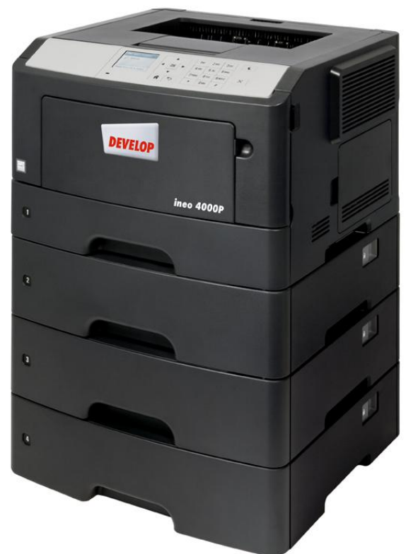
ineo 4000P z trzema dodatkowymi podajnikami papieru (PF-P12)

Jeżeli skomplikowany system operacyjny Twojej obecnej drukarki przyprawia Cię o ból głowy, a samo urządzenie jest trudne w obsłudze, czas, aby pomyśleć o zmianie na ineo 4000P. Kolorowy wyświetlacz o przekątnej 2,4 cala zapewnia intuicyjną obsługę, a podświetlane menu informuje użytkownika o stanie systemu, opcjach obsługi i ustawieniach. Co więcej, nawigacja oparta na układzie folderów oznacza, że ineo 4000P jest łatwiejsze w obsłudze niż wiele starszych systemów. Dzięki temu, Ty i Twoi pracownicy oszczędzacie czas i wysiłek podczas codziennego drukowania dokumentów. Poza tym, aby korzystać z tej nowej drukarki, nikt nie będzie musiał zaglądać do instrukcji obsługi.