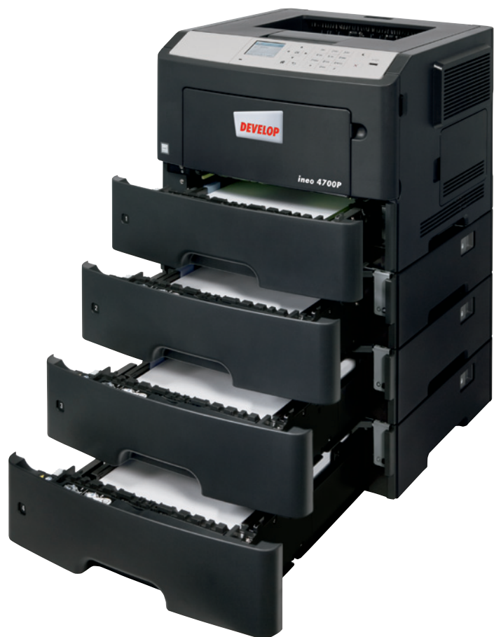
ineo 4700P z trzema dodatkowymi podajnikami papieru (PF-P12)

Jeżeli skomplikowany system operacyjny Twojej obecnej drukarki przyprawia Cię o ból głowy, a samo urządzenie jest trudne w obsłudze, czas, aby pomyśleć o zmianie na ineo 4700P. Kolorowy wyświetlacz o przekątnej 2,4 cala zapewnia intuicyjną obsługę, a podświetlane menu informuje użytkownika o stanie systemu, opcjach obsługi i ustawieniach. Co więcej, nawigacja oparta na układzie folderów oznacza, że ineo 4700P jest łatwiejsze w obsłudze niż wiele starszych systemów. Dzięki temu, Ty i Twoi pracownicy oszczędzacie czas i wysiłek podczas codziennego drukowania dokumentów. Poza tym, aby korzystać z tej nowej drukarki, nikt nie będzie musiał zaglądać do instrukcji obsługi.