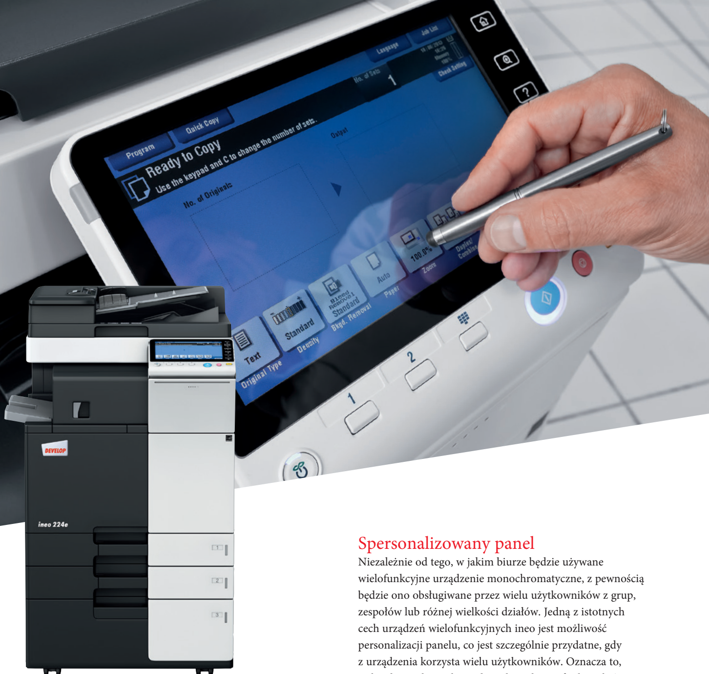
ineo 224e z podajnikiem dokumentów (DF-624), finiszerm wewnętrznym (FS-533) i kasetą dużej pojemności (PC-410)