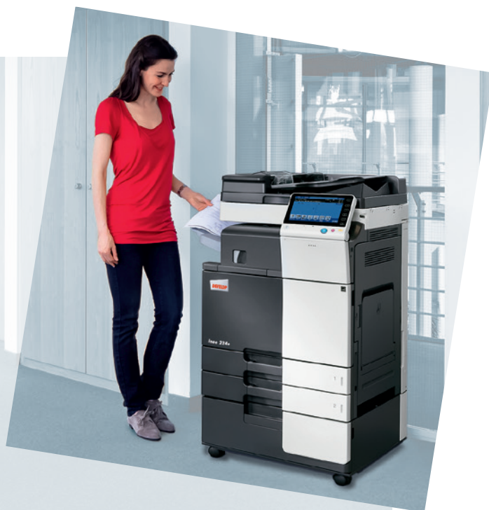
ineo 224e z podajnikiem dokumentów (DF-624), finiszerm wewnętrznym (FS-533) i kasetą dużej pojemności (PC-410)