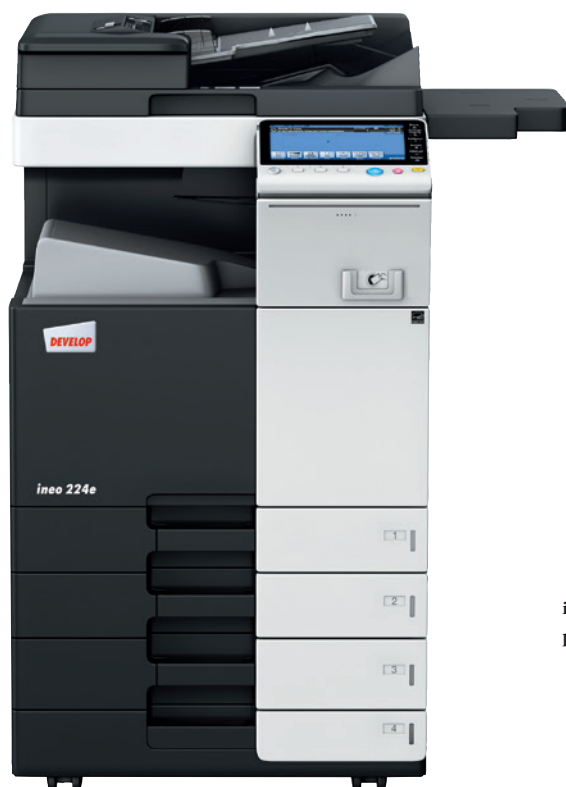
ineo 224e z podajnikiem oryginałów (DF-701), podajnikiem papieru (PC-210) i półką boczną (WT-506)

Każde z tych wielofunkcyjnych urządzeń – ineo 224e, ineo 284e, ineo 364e, ineo 454e oraz ineo 554e – jest nie tylko wyjątkowo proste w obsłudze, lecz również oferuje szeroką gamę funkcji ułatwiających wykonywanie codziennych prac biurowych. Oszczędzając czas na drukowaniu, kopiowaniu lub skanowaniu, użytkownik może szybciej zająć się swoją właściwą pracą. A to znacznie podnosi wydajność.