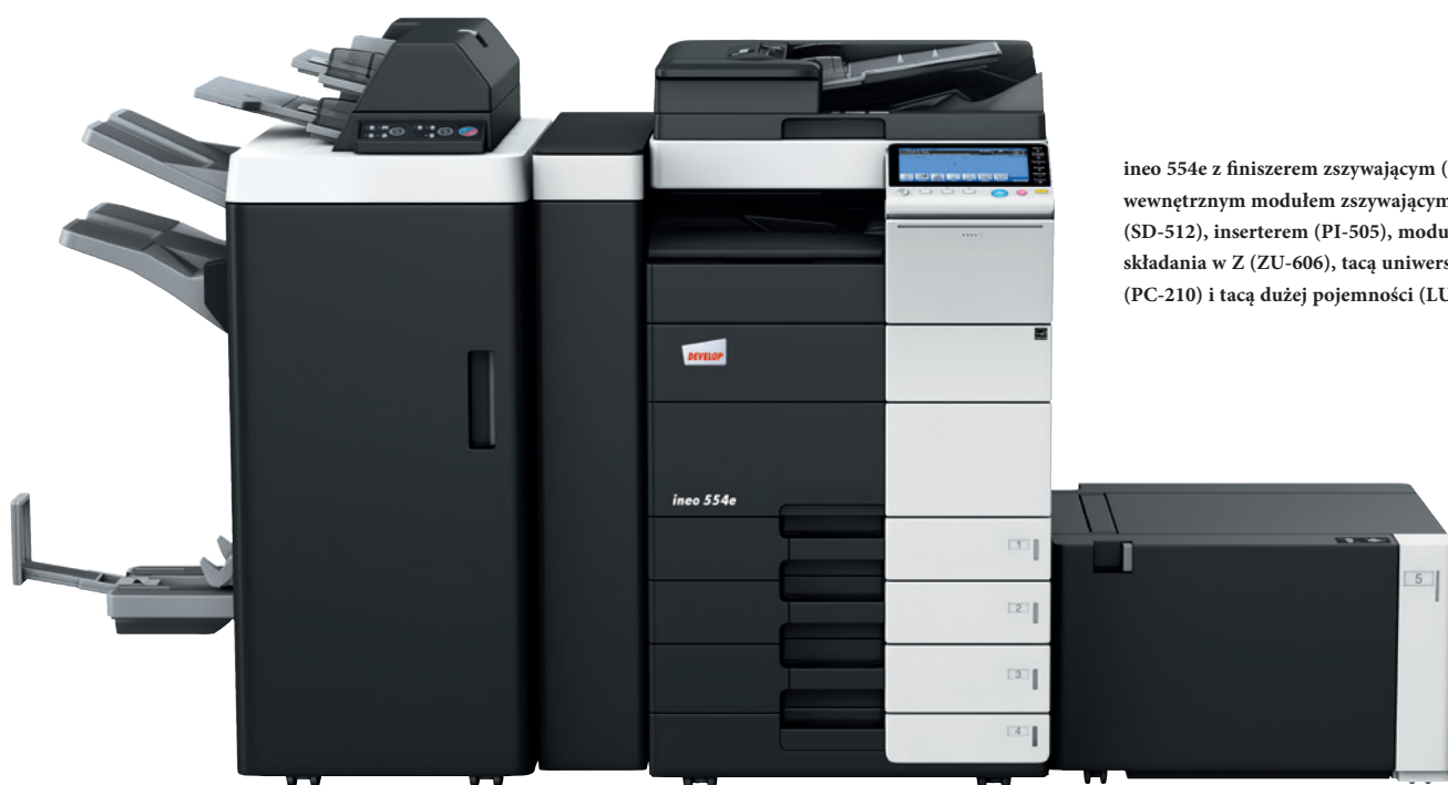
ineo 554e z finiszerm zszywającym (FS-535), wewnętrznym modulem zszywającym (SD-512), inserterem (PI-505), modulem składania w Z (ZU-606), tacą uniwersalną (PC-210) i tacą dużej pojemności (LU-204)

Każde z tych wielofunkcyjnych urządzeń – ineo 224e, ineo 284e, ineo 364e, ineo 454e oraz ineo 554e – jest nie tylko wyjątkowo proste w obsłudze, lecz również oferuje szeroką gamę funkcji ułatwiających wykonywanie codziennych prac biurowych. Oszczędzając czas na drukowaniu, kopiowaniu lub skanowaniu, użytkownik może szybciej zająć się swoją właściwą pracą. A to znacznie podnosi wydajność.