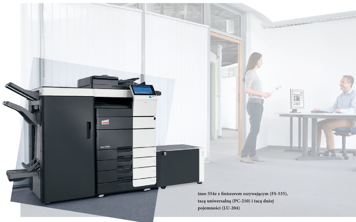
ineo 554e z finiszerm zszywającym (FS-535), tacą uniwersalną (PC-210) i tacą dużej pojemności (LU-204)

Te monochromatyczne systemy wyposażone są w liczne energooszczędne rozwiązania, które zmniejszają zużycie energii o ponad 40% w porównaniu do poprzednich modeli. Podczas gdy oszczędzają one pieniądze, inne ekologiczne rozwiązania są korzystne dla środowiska. Oznacza to, że oferowane przez DEVELOP urządzenia serii ineo e są nie tylko korzystne dla środowiska, ale również podkreślają troskę użytkownika o środowisko naturalne.