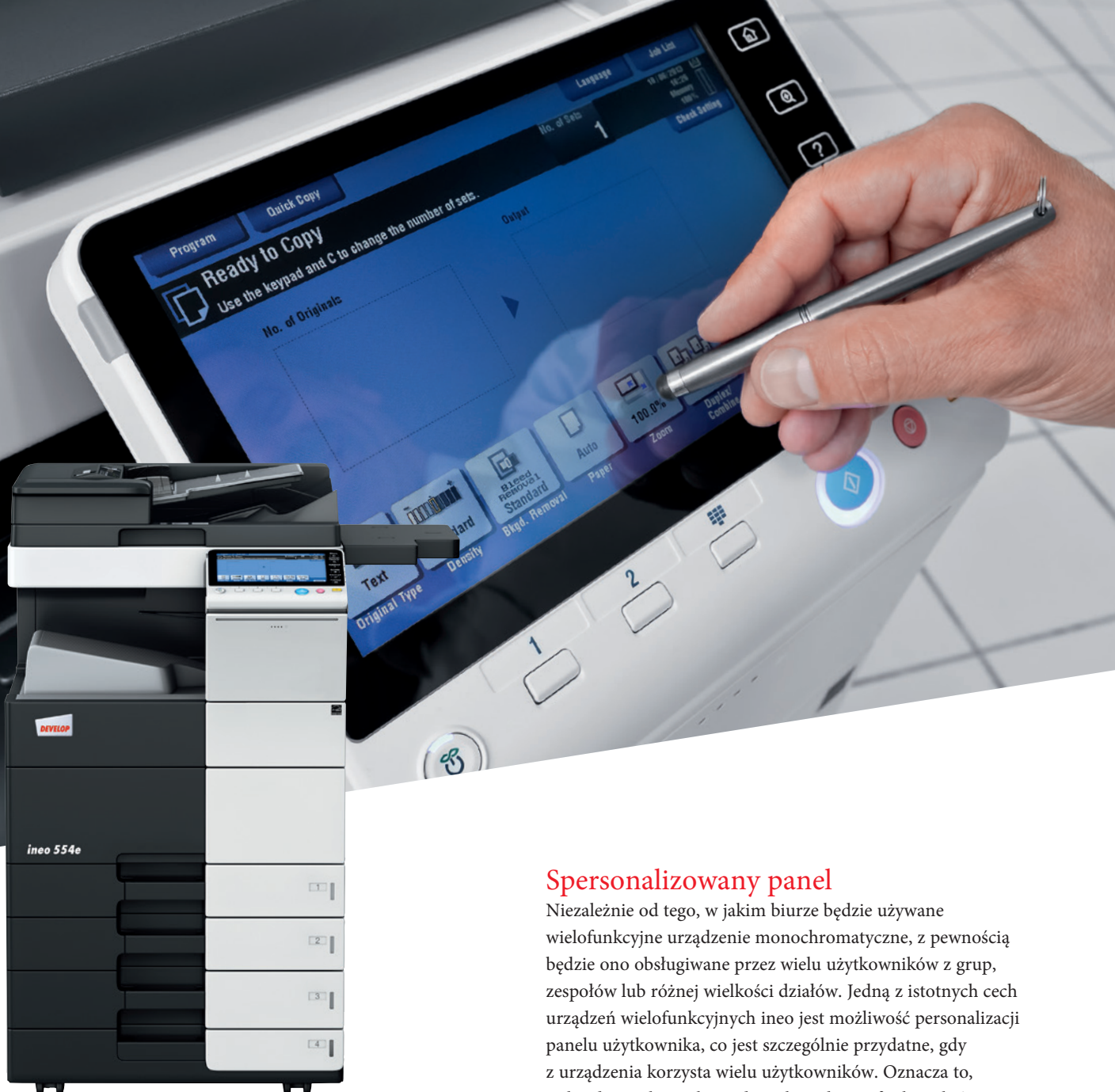
ineo 554e z tacą uniwersalną (PC-210), półką boczną (WT-506) i tacą odbiorczą (OT-506)