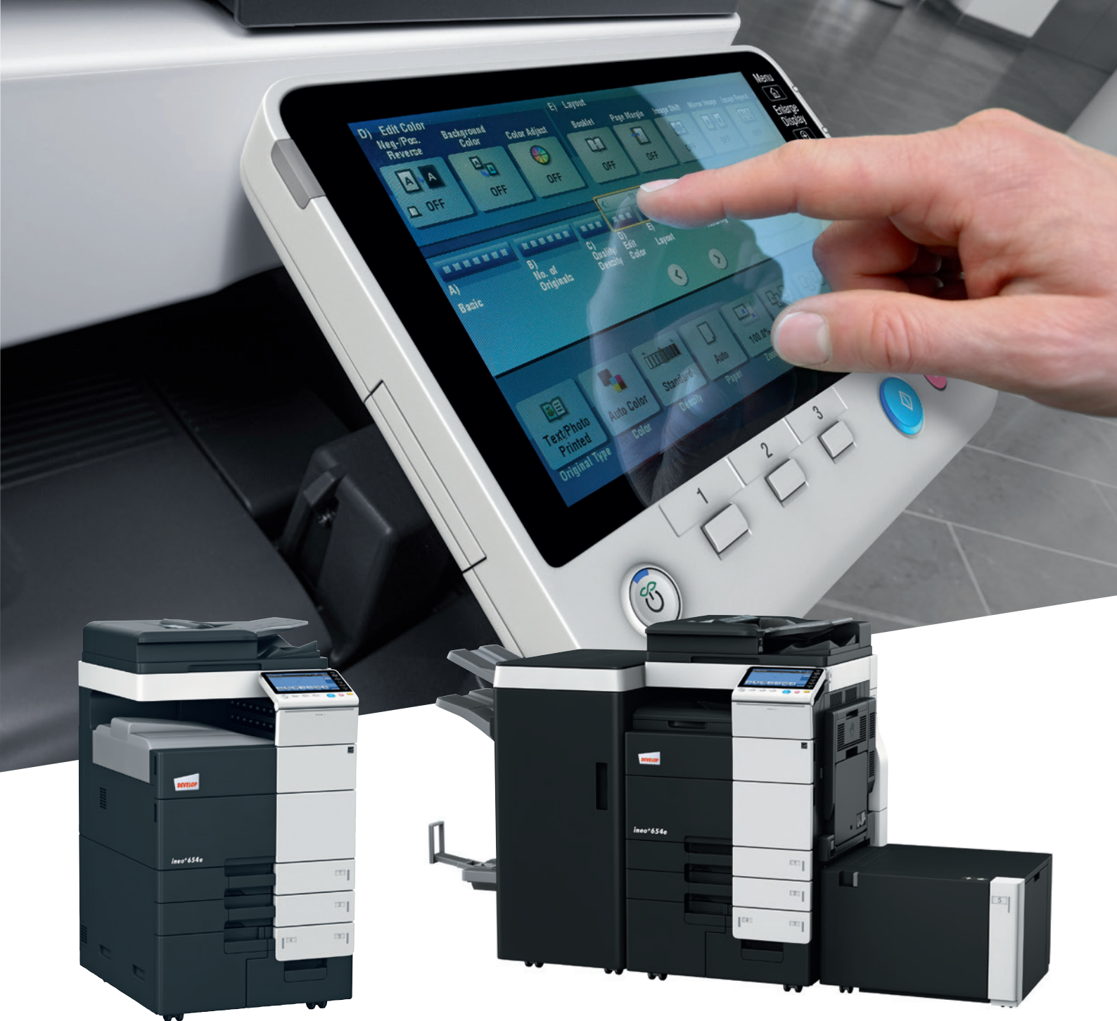
ineo+ 654e tacą odbiorczą (OT-503)