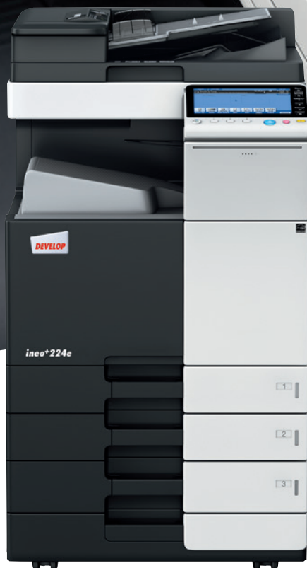
ineo+ 224e z podajnikiem papieru (PC-210) i podajnikiem oryginałów (DF-701)